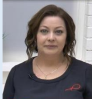
Pr Liubov Dolinina (Russie)

Auteur de « la Théorie des Eléments », « le secret des Lanthanides », « La classification périodique des plantes », « les minéraux »